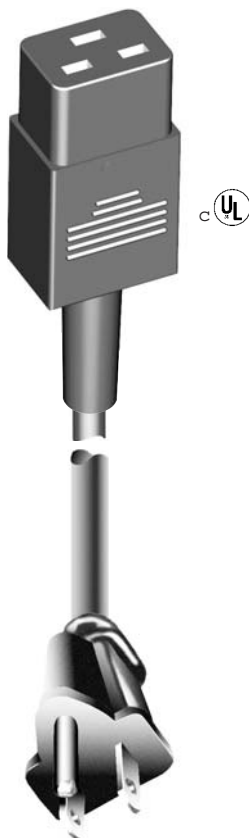
North America Standard / Norm NEMA 5-15