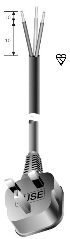
United Kingdom Standard / Norm BS 1363A (13 A Fuse fitted / 13 A Sicherung montiert)